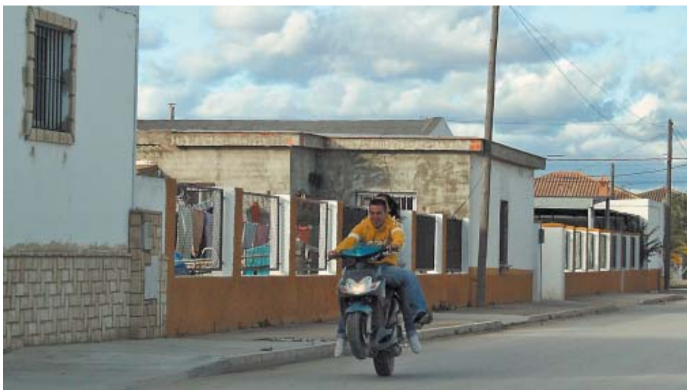
Los jóvenes motoristas sin casco, como este que conduce en la barriada de la Colonia Monte Algaida, abundan en todo Sanlúcar.

"Prefiero que en mi casa entre la Guardia Civil antes que el hambre", reconoce un pescador